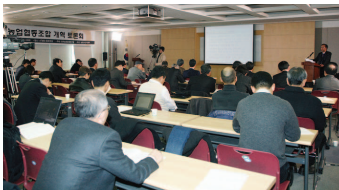
‘농업협동조합 지배구조 개선 방안’이란 주제로 토론회를 개최했다.

장, 조합장 1인 중심의 지배구조에서 협의체인 이사회 중심 지배구조로 전환, △조합원의 대표성을 강화하고, 조합원의 의사가 효과적으로 반영될 수 있는 지배구조 강화, △소유와 경영의 분리원칙에