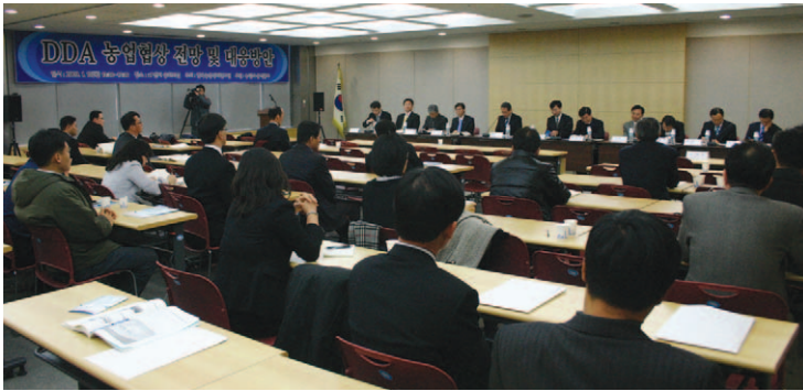
‘DDA 농업협상 전망 및 대응 방안’이라는 주제로 세미나를 개최했다.

우리 연구원과 농림수산식품부는 1월 15일 aT센터 중회의실에서 ‘DDA 농업협상 전망 및 대응 방안’이라는 주제로 세미나를 개최했다.