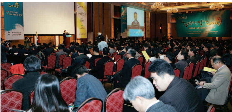
‘농업전망 2009’ 발표대회를 1월 21일 「한국 농업·농촌, 도전과 새로운 희망」이라는 주제로 개최했다.

우리 연구원 농업관측정보센터는 1월 21일 잠실 롯데호텔에서 ‘농업전망 2009’ 발표대회를 「한국 농업·농촌, 도전과 새로운 희망」이라는 주제로 개최했다. 이번 전망대회에는 장태평 농림수산식품부 장관 등 1천 5백여 명이 참석해 우리 농업·농촌에 다진 도전 요소를 살펴보고 희망을 모색하는 시간을 가졌다.