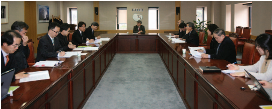
연구원은 2월 18일부터 올해 시작하는 22개 기본연구과제 설계세미나를 갖고 있다.

우리 연구원은 올해 연구사업을 농림업의 신발전 체제 구축 및 부가가치의 새로운 창출을 위한 식품산업 육성방안 연구와 농어촌지역의 복지 증진, 자유무역협정과 도하개발어젠다 등 국제화에 대응한 연구를 중점으로 추진하고 있다.