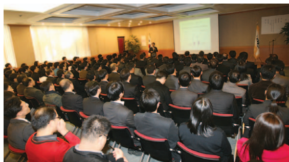
장태평 장관이 ‘위기를 넘어 새로운 농식품 시대로’라는 제목으로 특강을 했다.

우리 연구원이 2월 3일 개최한 월례조회에서 장태평 장관은 ‘위기를 넘어 새로운 농식품 시대로’란 제목으로 특강을 했다. 장 장관은 “현 우리나라 농업은 1970년대 제조업 수준과 비슷해 70년대의 제조 지원 방식을 적용하면 농업도 압축