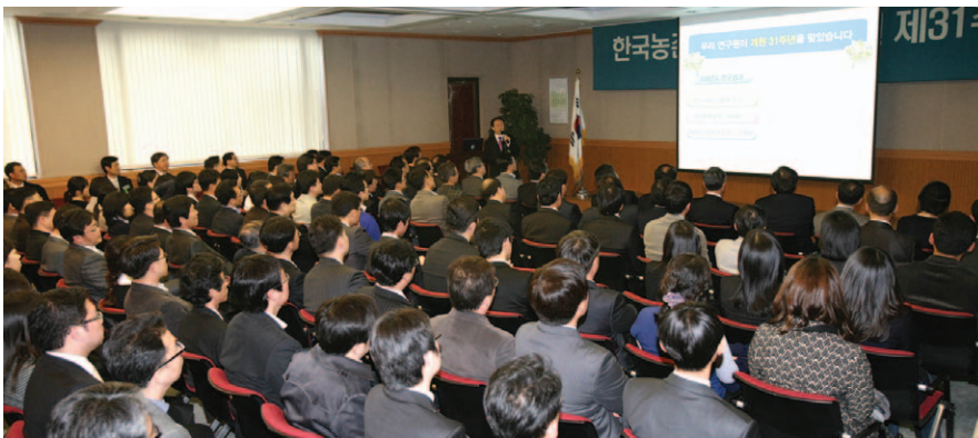
개원 31주년을 맞아 전직원은 주인의식을 갖고 목표를 향해 진력하자고 뜻을 모았다.

우리 연구원은 3월 31일 대회의실에서 열린 개원 31주년 기념행사에서 주인의식을 갖고 목표를 향해 진력하는 데 뜻을 모았다.