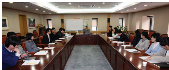
일본인의 채소 소비 전망을 주제로 3월 12일 KREI세미나를 개최했다.