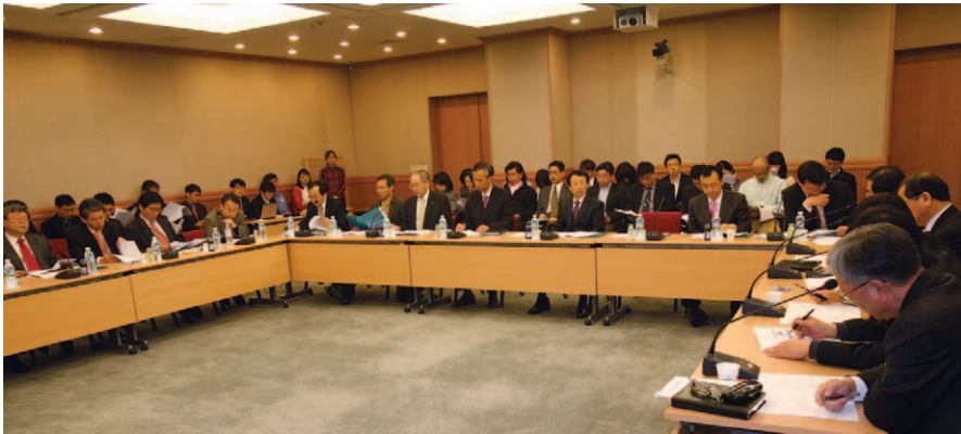
팀비전 및 발전전략 토론회를 3월 17일과 18일 대회의실에서 개최했다.

연구원은 3월 17일과 18일 대회의실에서 팀비전 및 발전전략 토론회를 개최했다. 이번 토론회는 조직개편에 따른 팀제 활성화와 조직문화 개선을 위한 토론의 장을 마련하고, 팀별 임무 정립, 비전과 발전전략 수립, 팀 역량 강화를 목적으로 개최하였다.