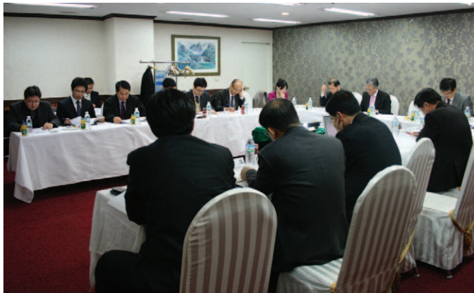
농식품정책연구본부는 '축산 발전 정책워크숍'을 농식품부와 공동으로 개최했다.

농식품정책연구본부 축산·환경팀은 3월 4일 과천 그레이스호텔에서 농림수산식품부 축산정책단과 공동으로 '축산발전 정책워크숍'을 개최했다. 또한 농업·농촌정책연구본부는 3월 20일에 양평 KOBACO연수원에서 농림수산식품부 농촌정책국과 살맛나는 농촌구현을 위한 농촌정책워크숍을 개최했다.