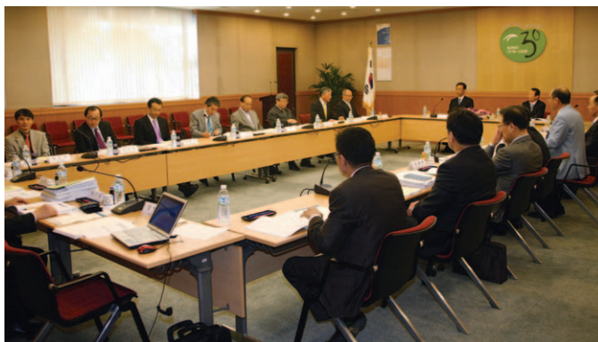
연구과제 심의·발굴을 위한 확대기조위를 10월 22일 연구원에서 개최했다.

연구원은 2010년도 연구과제 심의·발굴을 위해 10월 13일 잠실롯데호텔에서 농촌연구자문단회의를 개최했다. 또한 10월 22일 연구원 대회의실에서 확대기획조정위원회를 열었다.