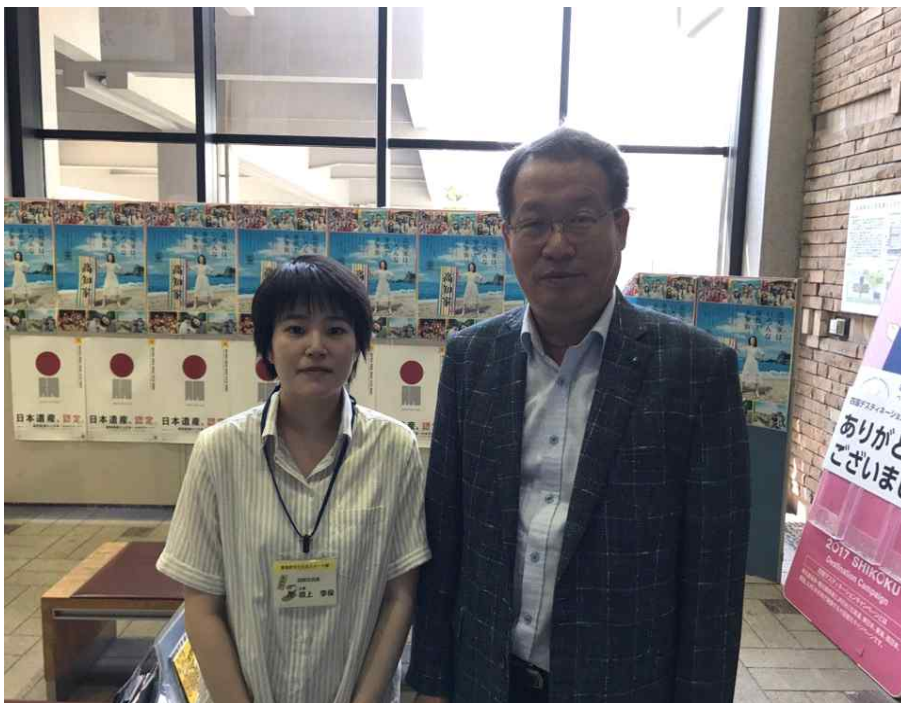
<고치현청 국제교류과 국제교류 담당 직원과 함께>