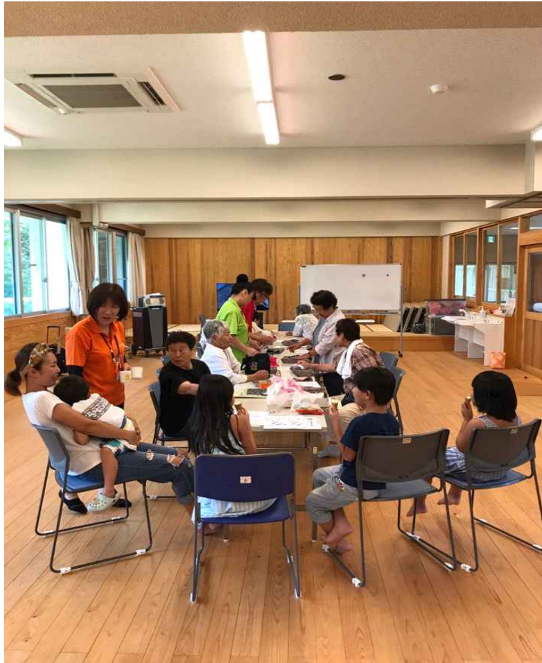
<노인들의 만들기 교실 활동>