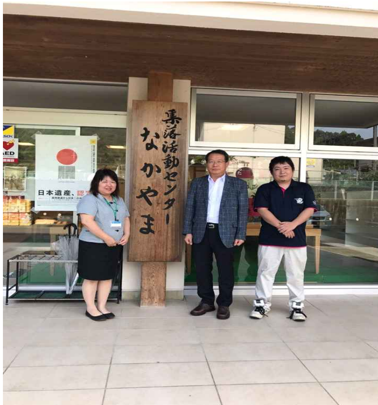
<안정정 집락활동센터 나카야마에서>