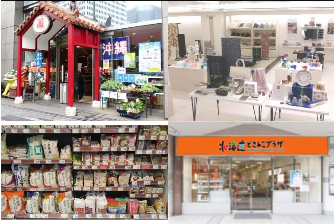
각 현의 동경 시내 안테나 숍