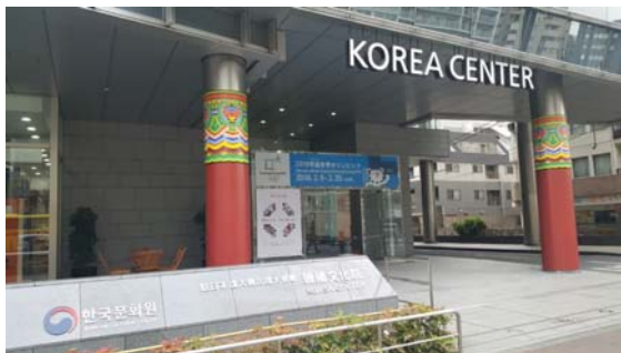
동경 신주쿠 한국문화관 내 aT 센터 회의실