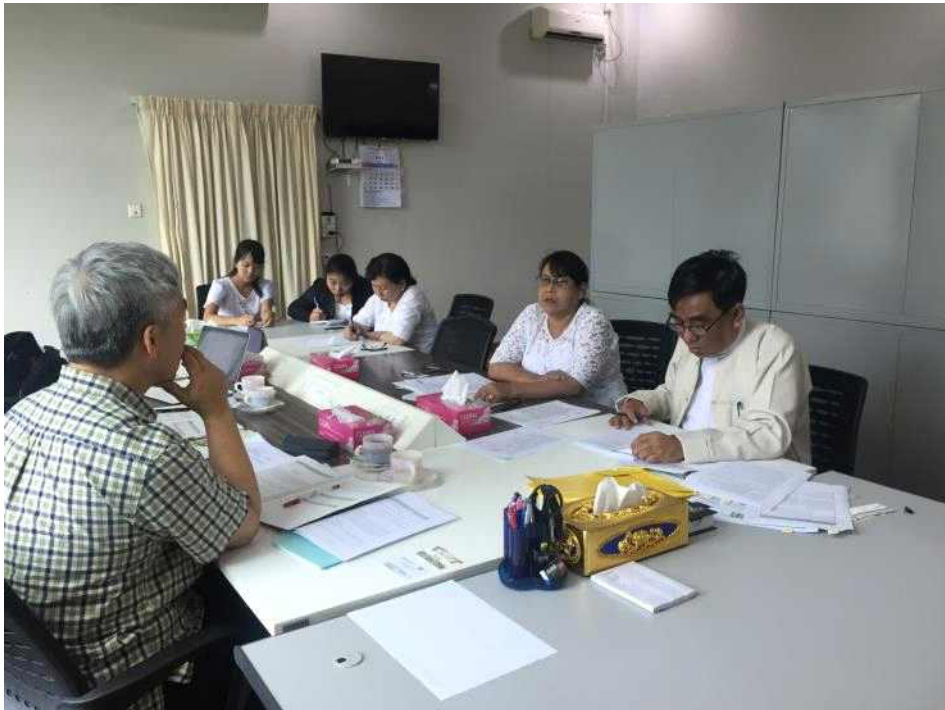
<MALI 예비 PCP 검토회의>