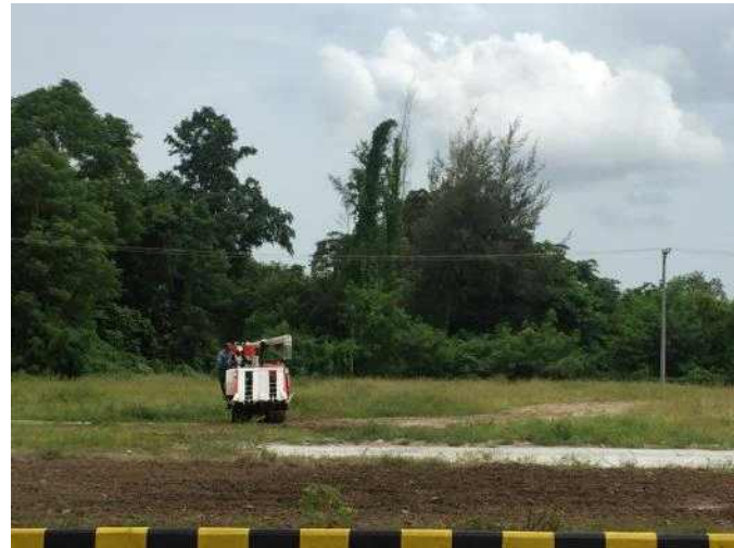
<농기계교육센터 예비 PCP 검토회의>