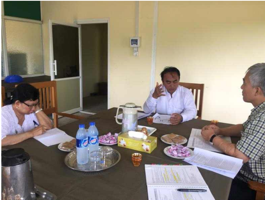
<농업연구소 예비 PCP 검토회의>