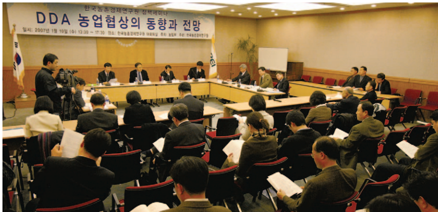
연구원은 DDA 농업협상 동향을 나누고 전망하는 정책세미나를 1월 10일 개최했다.

연구원은 1월 10일 대회의실에서 ‘도하 개발어젠다(DDA) 농업협상의 동향과 전망’이란 주제로 정책세미나를 개최했다.