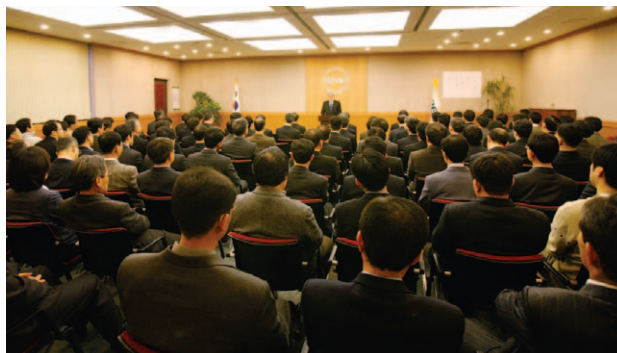
연구원은 1월 2일 시무식을 갖고 새해를 힘차게 출발했다.

연구원은 1월 2일 대회의실에서 시무식을 갖고, 서로 섬기는 자세로 화합, 협력하여 시너지를 내는 한 해가 되길 다짐하며 힘차게 출발했다.