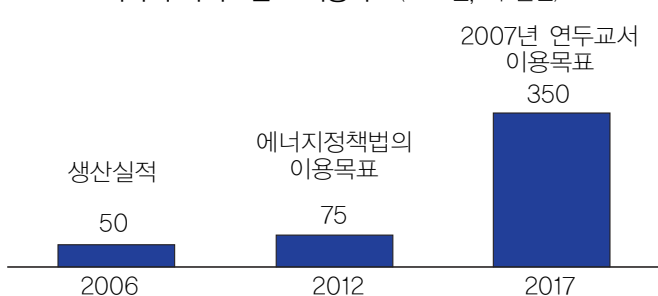
미국의 바이오연료 이용목표 (2017년, 억 갤런)

생산현장에서 증산이 가속화되는 가운데 부시 대통령은 지구 온난화에 나쁜 영향을 미치는 점에 대해 적극적으로 대응할 필요성을 언급하면서 가솔린 소비감축대책으로 바이오연료로의 대체를 강조하였다. 그리고 에탄올 등 대체연료의 이용목표를 2017년까지 350억 갤런으로 늘린다는 계획이다. 2006년 생산량의 7배에 상당하는 규모이다.