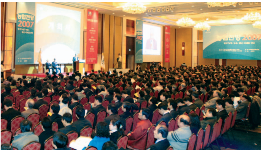
농업전망 2007 발표대회에 1천 6백여 명이 참가, 농업·농촌의 밝은 미래를 열기 위한 지혜를 나눴다.

연구원 농업관측정보센터는 1월 24일 잠실 롯데호텔에서 ‘농업전망 2007 발표대회’를 「한국 농업·농촌, 밝은 미래를 연다」라는 주제로 개최했다. 전망대회에는 박홍수 농림부 장관 등 1천 6백여 명이 참석해 성황리에 마쳤다.