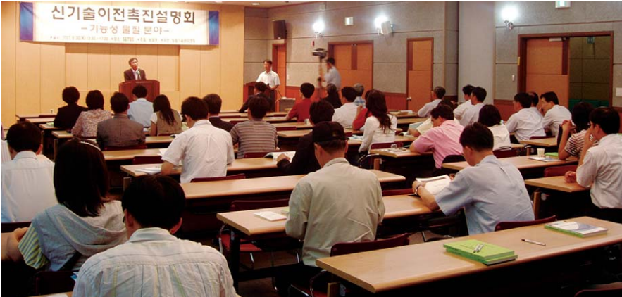
농림기술관리센터는 신기술이전촉진설명회를 8월 30일 서울무역전시컨벤션센터에서 개최했다.

연구원 부설 농림기술관리센터는 8월 30일 서울무역전시컨벤션센터(SETEC)에서 농림기술개발사업으로 개발된 특허 기술을 신속히 농산업 현장에 이전·확산시키고자 '신기술이전촉진설명회'를 개최했다. 이번 신기술이전촉진설명회에는 기능성 물질과 관련된 특허기술이 한 자리에 전시되어 더욱 내실있는 행사가 되었다.