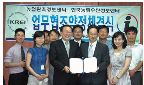
농업관측정보센터는 농림수산정보센터와 MOU를 체결했다.

농업관측정보센터는 8월 29일 농림수산정보센터 회의실에서 농림수산정보센터(AFFIS)와 업무협력협정(MOU)을 체결했다. MOU 체결로