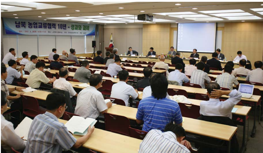
남북 농업교류협력 10년을 돌아보고 향후 과제를 발굴하는 심포지엄을 8월 28일 개최했다.

우리 연구원은 8월 28일 양재동 aT센터 중회의실에서 ‘남북 농업교류협력 10년-성과와 과제’라는 주제로 심포지엄을 개최했다.