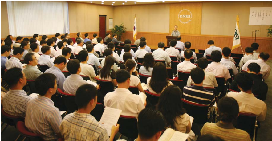
연구원은 8월부터 월례조례를 직원 참여형으로 바꿔 직원들의 관심속에 진행하고 있다.

연구원은 지난 8월 1일 개최한 월례조례를 직원 참여형으로 바꾸고, 대회의실에서 '이슈 알아봅시다'와 '부서이야기'라는 두가지 주제로 많은 직원들이 참석한 가운데 진행했다.